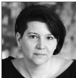
eye take your picture

Als Leiterin des Schauspielensembles Freies Theater Wiesbaden sowie von Emma & Co die Theaterwerkstatt bin ich seit Jahren auch kulturpolitisch aktiv.